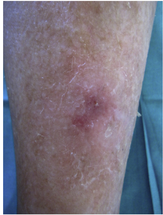
Figura 3 Leve eritema y descamación a los 3 meses de la sesión de terapia fotodinámica.

noma basocelular 1,2 . Por lo anterior, es importante decidir la conducta a adoptar ante esta dermatosis y conocer las distintas opciones terapéuticas.