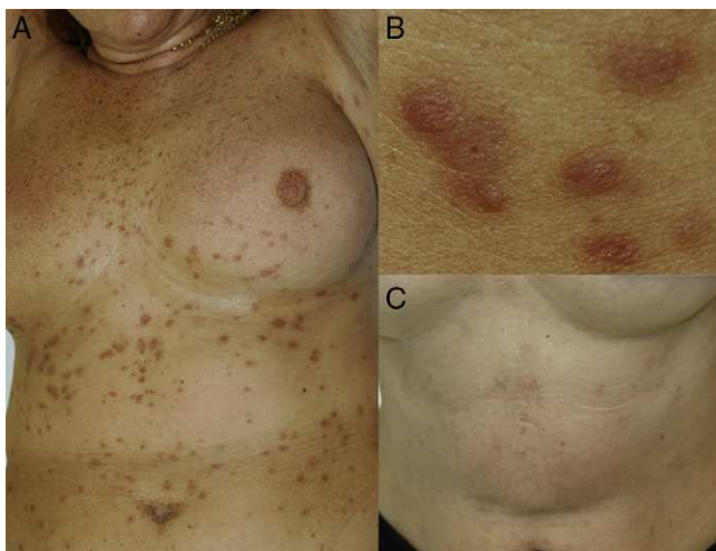
Figura 1 A. Múltiples lesiones papulosas de color pardo amarillento localizadas en tronco. B. Detalle de las lesiones. C. Lesiones cicatriciales hiperpigmentadas tras el tratamiento.

Un nuevo estudio histológico de otra de las lesiones cutáneas, que habían aumentado en número, mostró hallazgos superponibles a la primera biopsia, sin reordenamiento del gen IGH debido a que no había material genético suficiente. Se instauró tratamiento con fludarabina 40 mg, ciclofosfamida 250 mg 3 días y rituximab 375 mg/m 2 en 4 ciclos mensuales, completándose posteriormente con 4 ciclos de rituximab 375 mg/m 2 semanal. A los 6 meses de finalizar el tratamiento se observó una remisión completa de la neoplasia, así como una involución de las lesiones cutáneas que dejaron cicatrices deprimidas e hiperpigmentadas (fig. 1C). En el momento actual, tras 2 años de seguimiento, no hay indicios de recidiva hematológica ni nueva aparición de lesiones cutáneas.