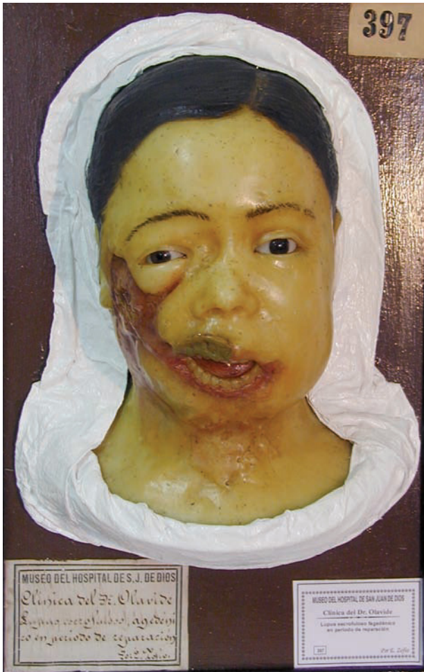
Lupus escrofuloso fagedénico en periodo de reparación.