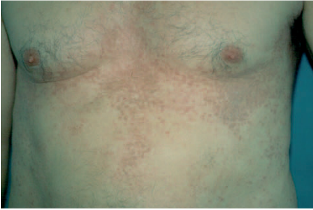
Fig. 1.—Múltiples pápulas eritematopardusas en el tronco del paciente.