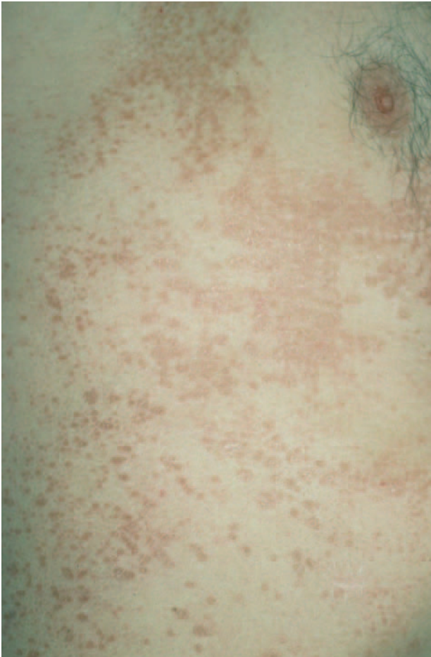
Fig. 2.—Cara lateral del tronco.