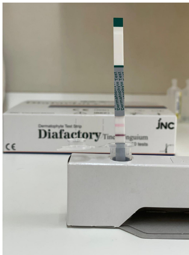
Figura 1 Resultado positivo.

De cada paciente se tomaban de forma simultánea dos muestras; una primera muestra se enviaba al servicio de microbiología para realizar el cultivo de hongos y una segunda muestra se empleaba en el test rápido de detección antigénica. Según se especifica en la ficha técnica del kit Diafactory®, se necesita una muestra de al menos 1 mg, lo que en la práctica clínica equivale a una muestra de 0,1-0,5 mm 2 .