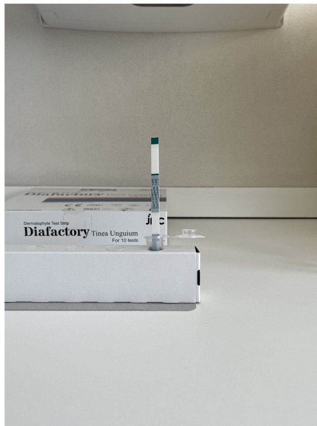
Figura 3 Resultado no válido.

Aquellos pacientes con un resultado positivo en el test rápido antigénico iniciaron tratamiento antifúngico y la mayoría fueron dados de alta del servicio de dermatología, para un posterior control evolutivo en atención primaria. Los pacientes con un resultado negativo en el test rápido antigénico fueron citados durante 3 semanas consecutivas para repetir la toma de muestras para cultivos seriados. Posteriormente fueron valorados en una cuarta cita hospitalaria, 4 semanas tras la última toma de cultivo para valorar los resultados y el inicio del tratamiento requerido.