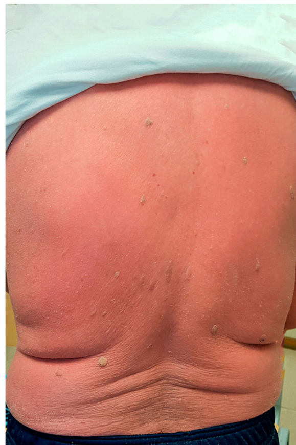
Figura 1 Eritema difuso en la espalda de un hombre de 71 años, en los días previos al ingreso.

Durante el ingreso, la debilidad progresó a una tetraparesia, con incapacidad para el movimiento de las extremidades cuando se ejercía una resistencia. Se realizó una punción lumbar y el líquido cefalorraquídeo resultó negativo para el virus del herpes simple (HSV) 1 y 2, el virus de varicela-zóster (VZV), el virus de Epstein-Barr (EBV), el enterovirus y el citomegalovirus. El paciente fue diagnosti-