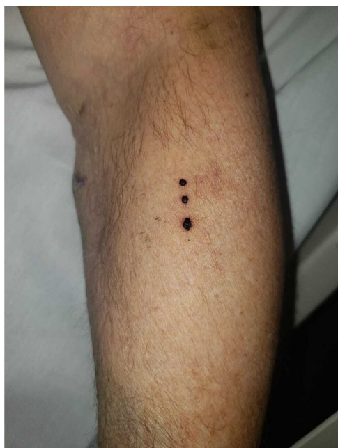
Figura 1 Presentación típica. Ampollas tensas de contenido hemorrágico, de distribución lineal, localizadas en el antebrazo izquierdo (caso 1).

La dermatosis ampollar hemorrágica (DAH) asociada a heparina es una entidad benigna, descrita por primera vez por Perrinaud en el año 2006 1-3 . Se comunican seis casos de DAH en pacientes adultos que fueron evaluados en el Servicio de Dermatología del Hospital Italiano de Buenos Aires, entre el 1 de septiembre del 2020 y el 31 de enero de 2022. Las características demográficas, clínicas y evolutivas de los mismos se obtuvieron a partir de la historia clínica electrónica (figs. 1-3).