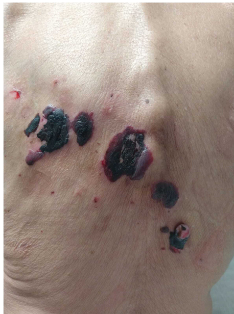
Figura 2 Presentación atípica. Ampollas de gran tamaño localizadas en dorso, de contenido hemorrágico. Refleja una mayor extensión y gravedad de la entidad (caso 3).