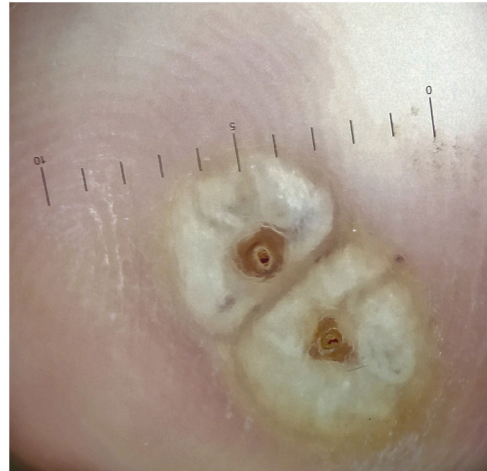
Figura 2 La dermatoscopia reveló un halo blanco de hiperqueratosis y un orificio central oscuro rodeado por una estructura ovoide blanca.