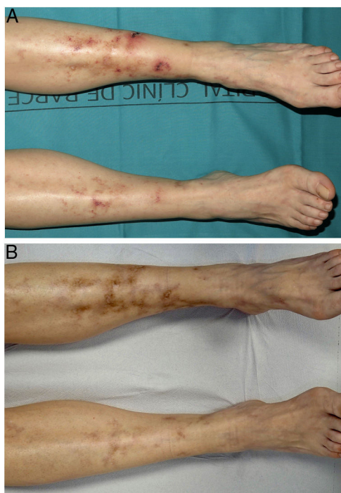
Figura 2 Vasculopatía livedoide (paciente 3). A. Úlceras, eritema y cicatrices atróficas en las piernas y tobillos. B. Respuesta completa tras 3 meses de tratamiento con rivaroxabán.

individuos. Las 4 pacientes de nuestro estudio han tenido un seguimiento mayor de un año, y 2 de ellas de 2 años o más, y en todas las pacientes se observó una respuesta terapéutica completa. Dos pacientes presentaron recurrencias al disminuir la dosis del rivaroxabán, que se resolvieron