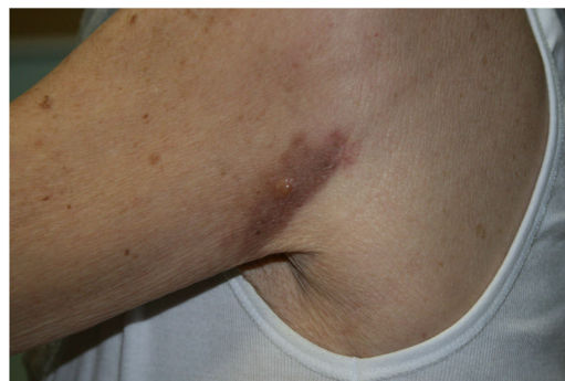
Figura 3 Revisión. Hombro izquierdo: mácula eritematoviolácea residual, con única vesícula en el centro.

disminuidas y fragmentadas. La dermis profunda presentó algunos vasos arborescentes de paredes delgadas.