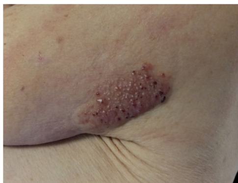
Figura 1 Primera consulta. Hombro izquierdo: placa de 8 x 5 cm, rojo-violácea, con superficie pseudovesicular y arracimada.

En la primera consulta se observó, en la cara posterior del hombro izquierdo, una única placa de 8 x 5 cm, de coloración rojo-violácea, con superficie pseudovesicular y arracimada (fig. 1). El estudio histopatológico reveló una epidermis conservada (fig. 2A). En la dermis papilar y reticular superior se observó un depósito difuso de mucina, positivo con la tinción de azul alcian, junto con un leve incremento de fibroblastos irregularmente dispuestos y un ligero infiltrado linfoplasmocitario perivascular (fig. 2B). Las fibras elásticas estaban