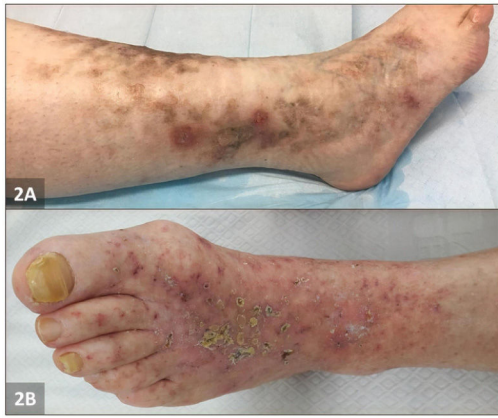
Figura 2 Imagen clínica de vasculopatía livedoide. A) Paciente 1: piel moteada y úlceras perforadas rodeadas de eritema purpúrico e hiperpigmentación. B) Paciente 2: múltiples ulceraciones y costras localizadas de tipo livedoide.

gradualmente la dosis de prednisolona (hasta 5 mg/día), manteniéndose la dosis estándar de aspirina como terapia de mantenimiento. Sin embargo, se documentó una nueva recidiva en 4 meses. Se introdujo una dosis de edoxabán (15 mg/día), con resolución clínica completa en 5 meses. A los 7 meses de seguimiento su situación era buena.