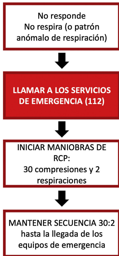
Figura 1 Algoritmo de RCP básica.

La mortalidad de la parada cardíaca ha permanecido estable durante más de 30 años, con tasas de supervivencia al alta hospitalaria del 10% (aunque existe disparidad regional, con una tasa que oscila entre el 1 y el 25%). También es causa de morbilidad, ya que genera el 4,5% de los años de vida ajustados por discapacidad 1-5 .