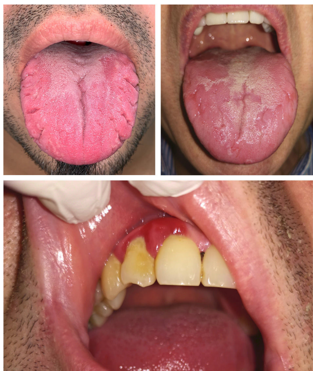
Figura 3 Lengua fisurada (arriba izquierda), lengua geográfica (arriba derecha) y periodontitis (abajo) en pacientes con psoriasis.

raciones microscópicas similares y por la presencia de un marcador genético común, el HLA-Cw6 18,19 . La masticación o el habla son factores que producen microtraumatismos en la lengua que podrían corresponder al fenómeno de Köebner, estimulando la aparición de la LG.