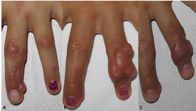
Figura 1 Caso 1. A) Placas induradas en tercer dedo de mano derecha. B) Recidiva en cuarto dedo tras intervención. C) Respuesta parcial tras un año de infiltración de esteroides y observación clínica.