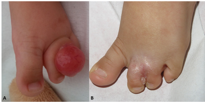
Figura 2 Caso 2. A) Nódulo rosado indurado entre segundo y tercer dedo de pie izquierdo. B) Recidiva meses después de exéresis completa y amputación digital.