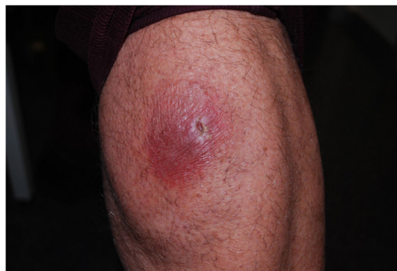
Figura 1 Imagen clínica, placa eritemato-violácea de aspecto atrófico en muslo.

Ante la sospecha diagnóstica de una micosis fungoide se realizó una biopsia cuyo estudio histológico mostró una hiperqueratosis sobre una epidermis con hiperplasia irregular y un edema con una proliferación de vasos de calibre pequeño y una discreta fibrosis en la dermis. No se objetivaron datos de malignidad en la muestra recibida. En el estudio inmunohistoquímico se constató que los vasos que constituían la lesión eran CD31 + y D2-40 -, SMA +, azul de Perls - (fig. 2).