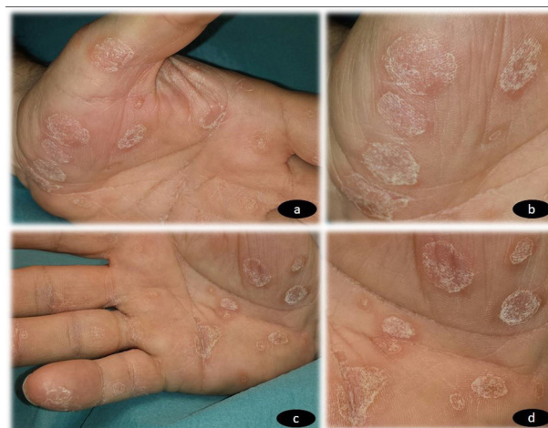
Figura 1 a) Placas hiperqueratósicas multifocales no confluentes en palma de mano izquierda. b) Múltiples placas hiperqueratósicas de bordes bien definidos en palma de mano izquierda. c) Placas hiperqueratósicas multifocales no confluentes en palma de mano derecha. d) Múltiples placas hiperqueratósicas de bordes bien definidos en palma de mano derecha.