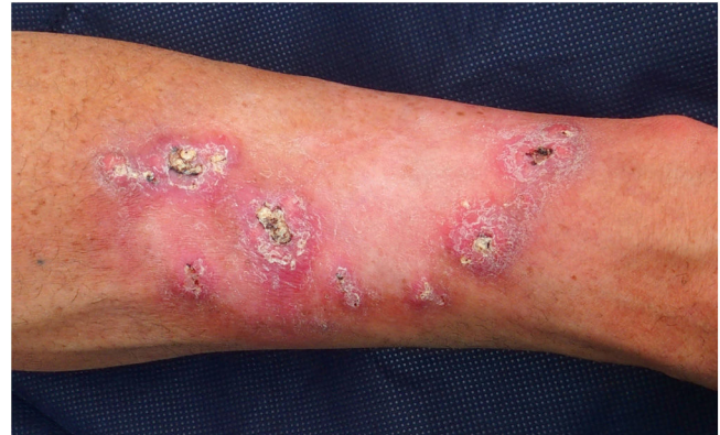
Figura 1 Keratoacantoma marginatum centrifugum. Nódulos queratinizantes de forma convexa de color rosado a color carne de 1 a 2 centímetros de diámetro con un tapón queratósico central, distribuidos en la periferia del campo de radiación previo (antebrazo izquierdo). El color de la figura solo puede verse en la versión electrónica del artículo.

El paciente 1 fue un varón de 54 años de edad sin antecedentes familiares relevantes e historia personal de exposición intensa a la luz del sol, que había tenido más de diez QA desde los 39 años. Había desarrollado lesiones centrifugas crecientes en el antebrazo izquierdo tras