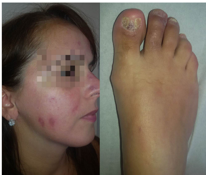
Figura 3 Evolución favorable a los 3 meses de tratamiento sistémico con prednisona asociada a hidroxicloroquina.

El tratamiento de la dactilitis sarcoidea requiere el uso de corticoides a dosis altas, asociados con antipalúdicos y metotrexato. En el caso de nuestra paciente, descartamos el empleo de metotrexato dados sus deseos genésicos, por