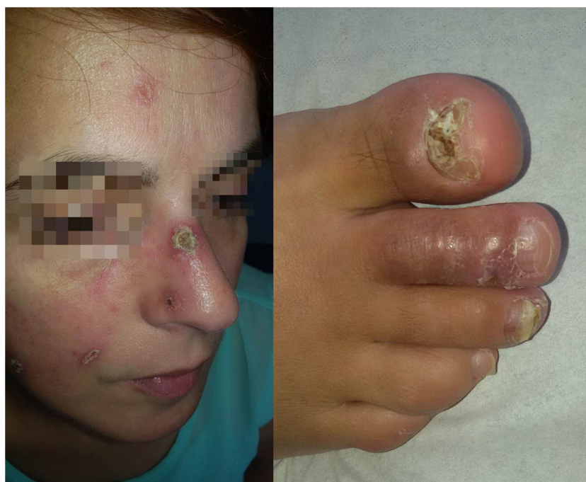
Figura 1 Lesiones de lupus pernio faciales eritematosas con costra en superficie. Dactilitis de 3 dedos del pie derecho asociada a onicopatía.

En la TAC se observaron los siguientes hallazgos: escasas adenopatías hiliares, mediastínicas subcarinales y retroperitoneales asociadas a unos micronódulos bilaterales en el tercio superior de los campos pulmonares.