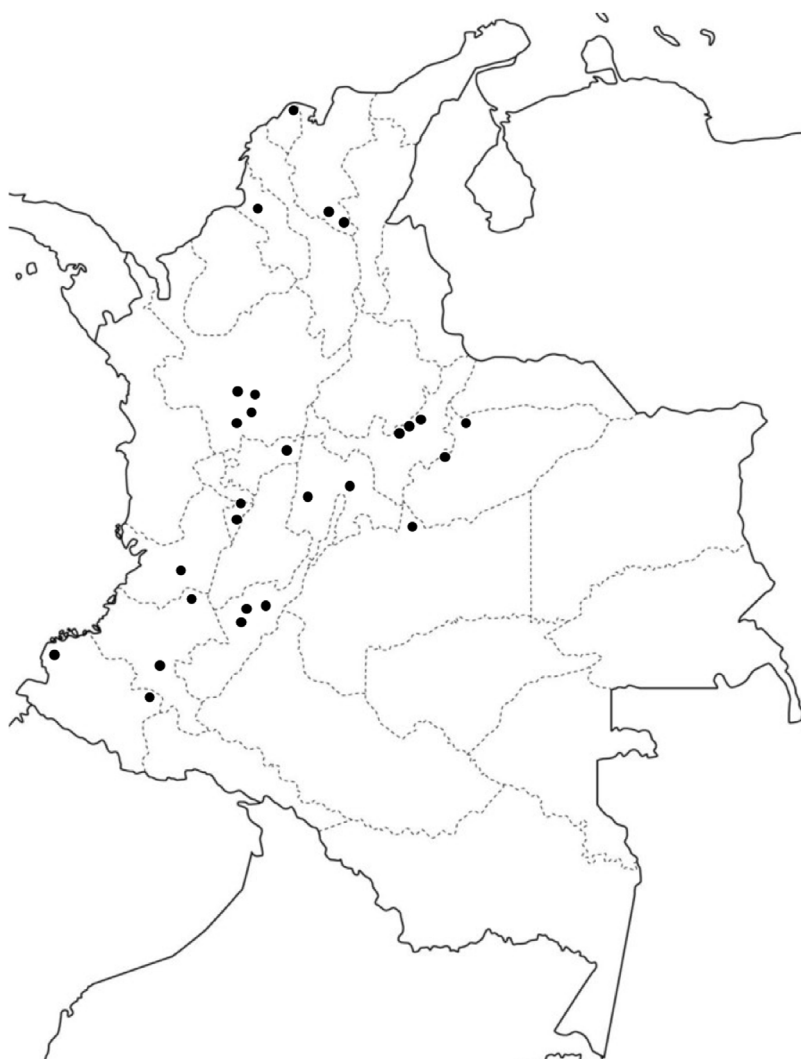
Figura 1 Distribución geográfica de la protoporfiria eritropoyética (PPE) en Colombia.

Así mismo, la expresión de la enfermedad puede cambiar con relación al grado de pigmentación de la piel, de forma que un mayor depósito de melanina resulta en síntomas menos pronunciados 6 . La PPE afecta relativamente igual a mujeres y hombres en Colombia, lo cual concuerda con lo observado en otras poblaciones. Los síntomas de PPE usualmente se inician en la infancia, por lo que la avanzada edad media al momento del diagnóstico en este estudio podría reflejar un prolongado retraso diagnóstico. Lo anterior, considerando que la mayoría de pacientes en países desarrollados con amplia experiencia en la atención de esta enfermedad reportan retrasos en el diagnóstico de hasta 18 años 2,7 . Se han demostrado deficiencias en el diagnóstico de las porfirias en Colombia, por lo que es esperable un mayor retraso diagnóstico 8 . Además, es probable que el predominio de raza mestiza en Colombia se relacione con una mayor proporción de casos leves. Una limitación de este estudio es que, a pesar de que la base de datos consultada permite identificar los casos con diagnóstico de PPE confirmado, no es posible verificar los métodos utilizados para la confirmación. Situaciones como errores de codificación y los límites en la cantidad de códigos diagnósticos disponibles