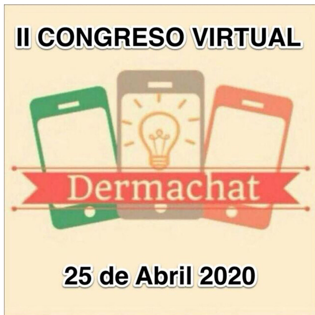
Figura 1 Logo del congreso.

A continuación, puede dejar reflejado cualquier comentario, crítica o sugerencia de mejora para futuras ediciones que considere oportuno