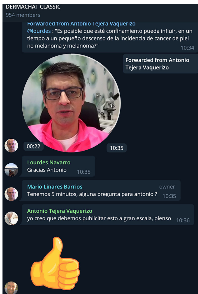
Figura 3 Captura de pantalla del chat durante el debate del 26 de abril de 2020. Las preguntas fueron formuladas durante las presentaciones del día anterior, y los ponentes enviaron sus respuestas a los moderadores previamente, utilizando videos de \leq 1 min que se mostraban uno detrás de otro de forma fluida y con transiciones eficientes (captura de pantalla autorizada por los participantes).

La opinión y las perspectivas futuras de los asistentes se pueden observar en la tabla 4. Todos los