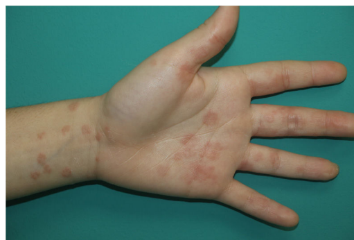
Figura 5 Erupción tipo eritema multiforme en el contexto de infección por SARS-CoV-2.