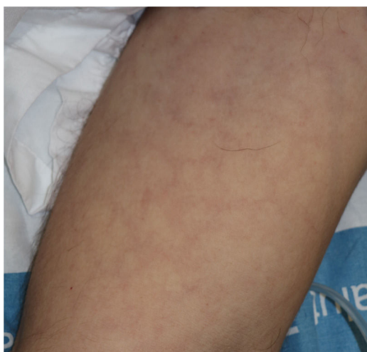
Figura 7 Erupción livedoide de curso transitorio en el tronco en un paciente con variante grave de COVID-19.

clínica o su valor pronóstico o diagnóstico. En la mayoría de los casos los exantemas maculopapulares aparecen ya sea acompañando o bien a los pocos días del inicio de la clínica respiratoria característica 11,28,32,33 . Sin embargo, en nuestro centro hemos podido comprobar erupciones más o menos generalizadas, maculopapulares, algunas similares a eritema multiforme, en pacientes jóvenes, con historia de síntomas leves o incluso asintomáticos, aunque con antecedentes epidemiológicos de infección por SARS-CoV-2 y que serían compatibles con las que pueden verse en otras infecciones víricas.