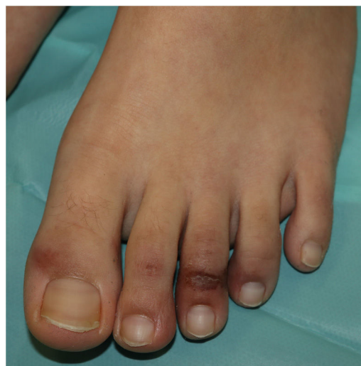
Figura 1 Pápula perniosisiforme acral.

Las lesiones perniosisiformes acrales —descritas por Galván et al. 11 como lesiones acrales, eritematosas y edematosas, con formación de vesículas y pústulas— son probablemente las más características asociadas a la pandemia por SARS-CoV-2. La descripción y la comunicación de estas lesiones se llevó a cabo de forma inicial fuera de los circuitos académicos, de modo informal en redes sociales médicas o dermatológicas, a partir de imágenes procedentes de familiares, conocidos y colegas compartidas a través de las redes sociales. El primer caso publicado al respecto describía a un adolescente de 13 años que desarrolló lesiones purpúricas en los pies que precedieron el desarrollo de sintomatología sistémica —fiebre, dolor muscular, cefalea— en el contexto de una familia en la que se presentaron casos sugestivos de COVID-19 en el momento de la eclosión de la pandemia en Italia 12 . Sin embargo, no se llegaron a realizar estudios microbiológicos específicos. Los autores refieren en su manuscrito, en ese momento, la existencia de una «epidemia» de lesiones similares en niños con sospecha de COVID-19 en Italia. En la serie de Galván et al. 11 las