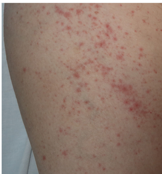
Figura 4 Rash exantemático inespecífico, de distribución perifolicular en el contexto de COVID-19.

fase con queratinocitos necróticos ocasionales, hallazgos más cercanos al patrón de eritema multiforme 24 .