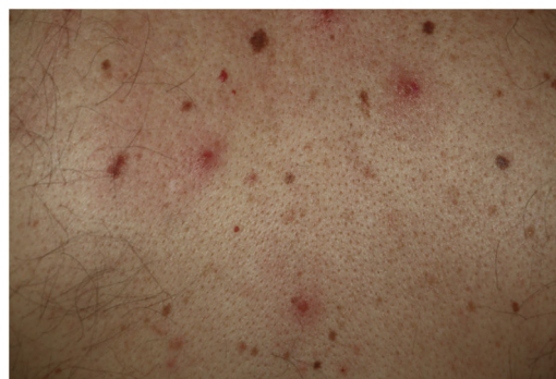
Figura 2 Papulovesículas monomorfas dispersas en el tronco.

Las lesiones vesiculares, habitualmente monomorfas, aparecen de forma precoz y en ocasiones (15%) preceden a otros síntomas 11 , aunque en la mayoría de casos —hasta el 79,2% en una serie de 24 pacientes de Fernandez-Nieto et al.— suceden al inicio del resto de sintomatología 20 . La afectación del tronco es casi constante y en el 20% lo hacen también las extremidades (fig. 2). De forma excepcional se ha descrito la afectación facial y mucosa. Las lesiones cutáneas son escasamente sintomáticas, en forma de prurito —generalmente leve—, y en menor frecuencia de dolor o sensación de quemazón 11,19 . Aunque las lesiones pueden ser dispersas, es más frecuente el patrón extenso diseminado —el 75% en la serie de Fernandez-Nieto et al.—. En algunos pacientes pueden afectar a las extremidades inferiores, presentar un contenido hemorrágico o ser de gran tamaño y distribución difusa. La duración media