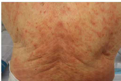
Figura 3 Exantema maculopapular en un paciente con COVID-19 y neumonía bilateral secundaria, que recibió diferentes fármacos. El diagnóstico diferencial con respecto a una toxicodermia es difícil.