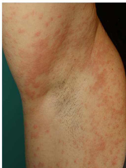
Figura 6 Erupción exantemática periaxilar similar a SDRIFE.

En este apartado se incluye un grupo heterogéneo de erupciones que, consideradas en conjunto, y dada la dificultad de su subcategorización, representan el 47% de las manifestaciones cutáneas de la COVID-19 11 . En ocasiones estos exantemas pueden acompañarse de un componente petequeal o con máculas o áreas más extensas de aspecto purpúrico. En otros casos las lesiones presentan una distribución marcadamente perifolicular (fig. 4), o con grados variables de descamación, algunas descritas como similares a la pitiriasis rosada 25 . También se han observado pápulas infiltradas en las extremidades, pseudovesiculares o similares al eritema elevatum diutinum o al eritema multiforme, ocasionalmente pruriginosas 26 (fig. 5). Se ha descrito también un desarrollo marcadamente craneocaudal, con afectación de los pliegues y sin afectación de la región palmo-plantar ni de las mucosas 27,28 .