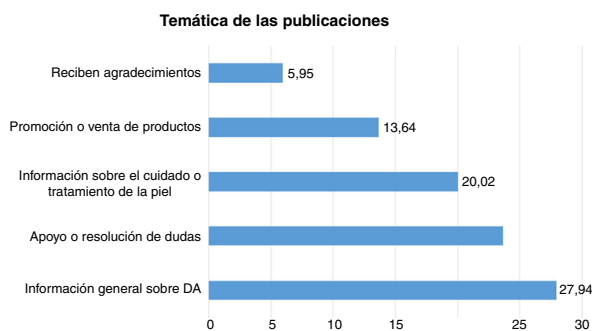
Figura 2 Temáticas observadas con mayor frecuencia en el análisis de 909 publicaciones en Facebook, Twitter y LinkedIn.

intervenciones conductuales o de prevención basadas en experiencias y opiniones poblacionales.