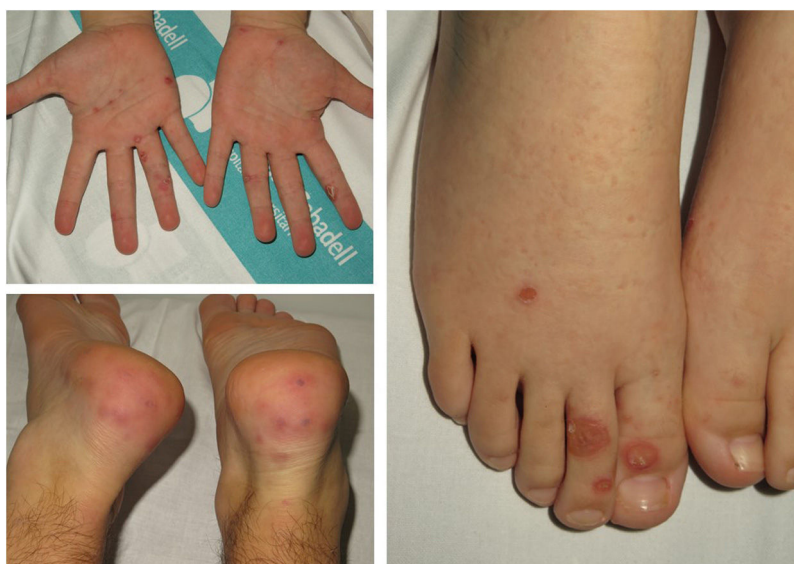
Figura 2 Lesiones redondeadas purpúricas predominando en las plantas o los talones.

19 durante el mes de febrero o principios de marzo, sin síntomas clínicos, lo que habría hecho que el virus no pueda ser detectado ya con la técnica de PCR. Una segunda explicación podría ser la baja sensibilidad de las pruebas rápidas de IgG/IgM, o la rápida desaparición de los anticuerpos circulantes, con niveles bajos que no llegan al umbral de detección de la técnica. Una tercera comprendería diferentes factores etiopatogénicos relacionados con el confinamiento, que no se han identificado hasta la fecha. Un estudio más detallado de más biopsias de piel, perfiles de autoinmunidad en suero y detección cuantitativa por PCR más refinada están en curso, para dilucidar la causa de estas lesiones dermatológicas.