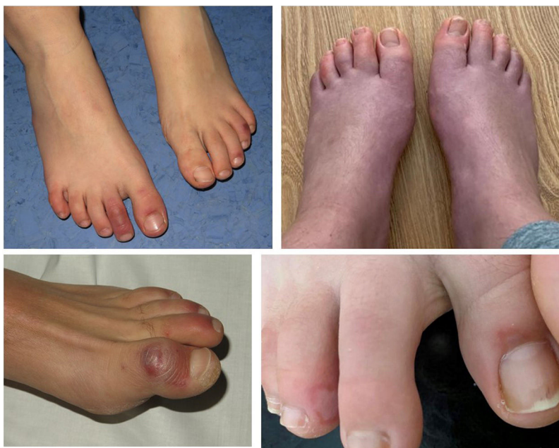
Figura 1 Lesiones perniónicas y edema en las manos y los pies.