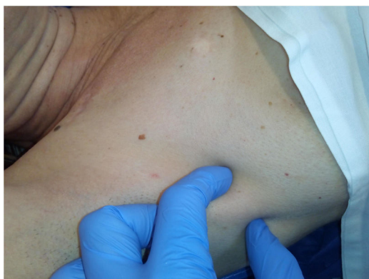
Figura 1 Metástasis ganglionar en axila derecha.