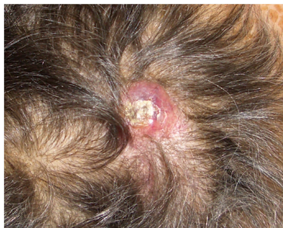
Figura 1 Nódulo eritematoso con costra superficial en el cuero cabelludo.

tes son el pulmón, la pleura y los ganglios linfáticos, más raras son las metástasis cutáneas 2 . Hasta ahora, existen 7 reportes en la literatura de metástasis cutánea de glioma cerebral grados III-IV (tabla 1), siendo el nuestro el primer caso de metástasis cutánea de GBM sin recurrencia de la enfermedad intracraneal 3 . Se observa habitualmente en pacientes con antecedentes de procedimientos quirúrgicos invasivos, lo que hace creer que la siembra metastásica iatrogénica juega un papel fundamental. Sin embargo, en el 10% de pacientes estas metástasis extracraneales surgen sin evidencia de cirugía previa 4 o en una localización alejada de la intervención 5 , por lo que probablemente existan otras rutas de diseminación (vascular, linfática, perineural, extensión directa). Algunos estudios sugieren que la mutación del gen EGFR es un factor predisponente para el crecimiento extracraneal del GBM 6 , lo que no se dio en nuestra paciente siendo su determinación negativa. Otras teorías sugieren que el GBM promueve una angiogénesis defectuosa originando zonas hipóxicas en la barrera hematoencefálica con su consiguiente disrupción 7 . Otra posibilidad es que sea una entidad infradiagnosticada debido a la baja supervivencia de estos pacientes, no exis-