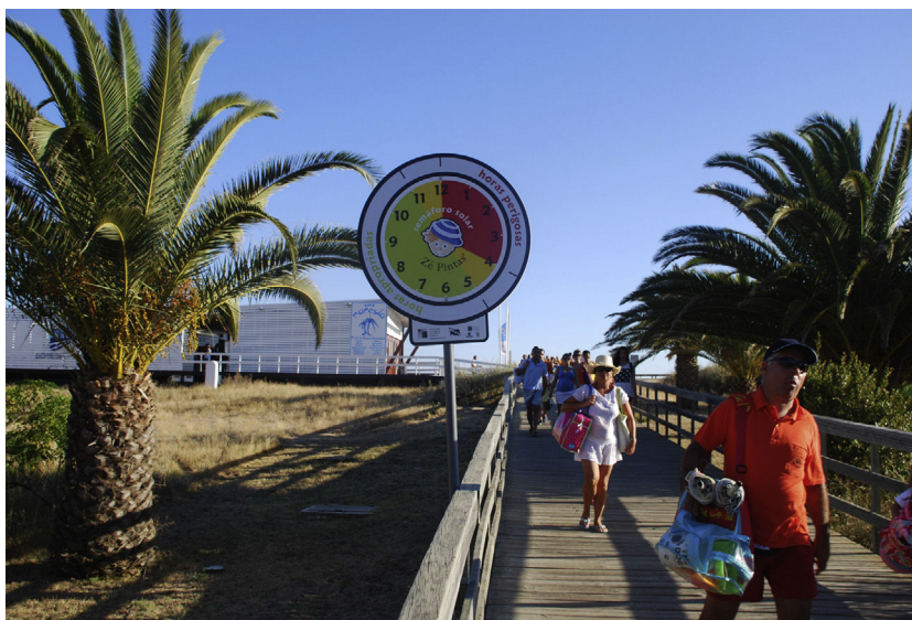
Figura 1 Imagen de un reloj solar.

En términos generales, el número de entradas de 8 a. m. a 11 a. m. mejoró de 2009 a 2014 (del 26 al 30%, p < 0,001 ).