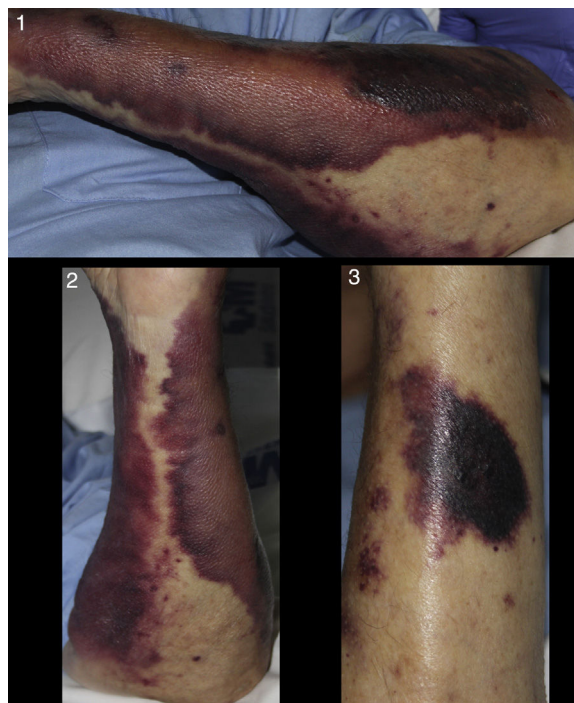
Figuras 1, 2 y 3 Máculas purpúricas confluentes y extensas, de bordes netos, con algunas placas discretamente sobreelevadas de tonalidad más oscura, parcheadas.

Consultó a los 2 meses del alta por un cuadro de dolor incoercible en el contexto de una neuralgia posherpética. Se ingresó de nuevo en medicina interna para control analgésico, y a los pocos días solicitaron una interconsulta a dermatología por la aparición brusca de unas lesiones cutáneas en miembros superiores. En nuestra valoración objetivamos una recurrencia de las máculas purpúricas en dicha localización que, según su familiar, habían llegado a remitir, sin saber precisar el tiempo exacto de evolución en esta ocasión. Las lesiones abarcaban una extensa superficie de ambos antebrazos y presentaba algunas lesiones papulonodulares sobre una base violácea más intensa (fig. 1, 2 y 3). Se realizó una segunda biopsia cutánea con muestra para cultivo ante la sospecha de una recurrencia o persistencia de la infección fúngica, si bien la morfología de las lesiones y su rápida instauración obligaron a descartar una púrpura fulminans. El estudio de coagulación urgente no mostró alteraciones compatibles con este último cuadro. El estudio histopatológico fue superponible al de la primera biopsia realizada, con evidencia de estructuras micóticas mediante tinción de PAS y de nuevo aislamiento de S. apiospermum . En los días sucesivos, el paciente, que recordamos padecía un carcinoma de próstata metastásico, un linfoma no Hodgkin y una arteriopatía