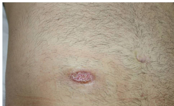
Figura 3 Rápida mejoría clínica de la úlcera inicial tras 3 semanas de tratamiento con prednisona oral.

El diagnóstico definitivo de esta entidad puede ser complicado, ya que los hallazgos clínicos, de laboratorio e histopatológicos no son específicos. Por ello, la evaluación diagnóstica del paciente con sospecha de pioderma