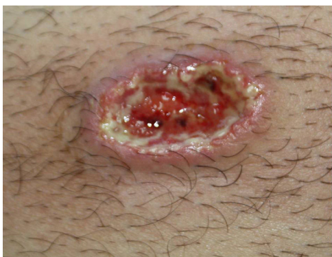
Figura 1 Lesión ulcerosa de 3 x 1,5 cm de borde violáceo indurado, base necrótica y exudado fibrinopurulento en flanco derecho.

ciclosporina oral a dosis de 5 mg/kg/día, con respuesta parcial y mal control de la tensión arterial. Finalmente se inició tratamiento con infliximab a dosis de 5 mg/kg/cada 8 semanas, con buen control clínico y sin datos de recidiva tras 18 meses de seguimiento.