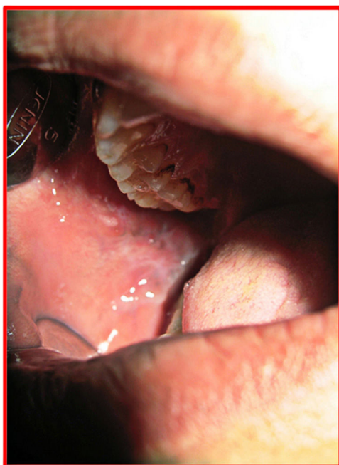
Figura 2 Segunda paciente. Fotografía tras el tratamiento.

LLLT se logró la curación casi completa, con una puntuación clínica y EVA de 1 (fig. 2). A lo largo del año de seguimiento postratamiento, la paciente se mantuvo asintomática y no hubo recurrencia de la lesión.