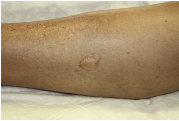
Figura 1 Ampolla de mediano tamaño y contenido seroso en la cara lateral interna de la pierna derecha (paciente 3).

El diagnóstico diferencial debe realizarse fundamentalmente con 3 entidades: las ampollas secundarias a reacciones fototóxicas, la pseudoporfiria y el penfigoide ampoloso inducido por PUVA 10 . Las principales características de cada una de estas entidades se reflejan en la tabla 2 .