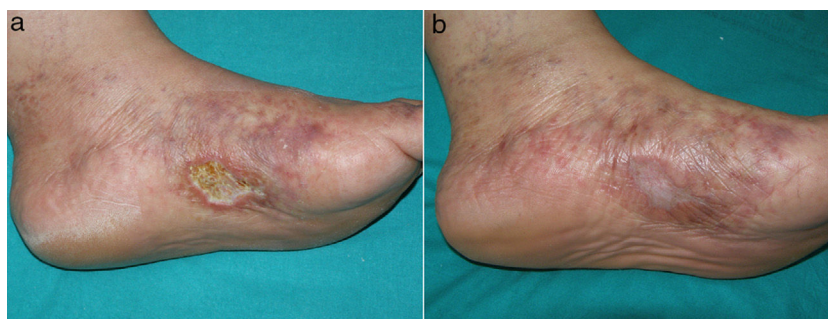
Figura 1 a) Úlcera cutánea en cara medial del pie izquierdo sobre un fondo de livedo racemosa y púrpura retiforme. b) Atrofia blanca secundaria a la cicatrización tras el uso de rivaroxabán oral.

Una mujer de 53 años sin antecedentes de interés consultó por múltiples úlceras cutáneas dolorosas en ambos pies de 2 años de evolución. A la exploración física presentó una úlcera de aproximadamente 3 cm en cara medial del pie izquierdo sobre un fondo de livedo racemosa y púrpura retiforme (fig. 1a). La historia clínica y las pruebas complementarias descartaron estado de hipercoagulabilidad, enfermedad inflamatoria sistémica o enfermedad infecciosa. En la evaluación de enfermedad arterial periférica no se detectaron alteraciones del índice tobillo-brazo ni de la ecografía doppler. La biopsia cutánea mostró trombos de fibrina en los vasos dérmicos, extravasación hemática, hialinización de la pared de los vasos y neovascularización