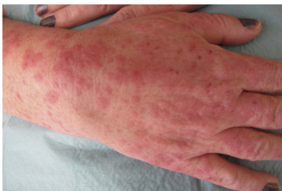
Figura 1 Lesiones eritematoedematosas en manos, algunas con morfología en diana.

El examen histopatológico de una de las lesiones del codo izquierdo mostró un infiltrado inflamatorio linfocitario en dermis con disposición preferentemente perivascular, exocitosis epidérmica y algunos focos de necrosis epitelial, con