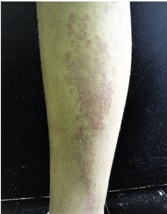
Figura 1 Imagen clínica del paciente con liquen estriado.