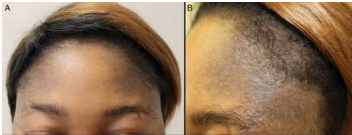
Figura 1 . A y B) Múltiples máculas milimétricas, confluentes, formando una mancha de aspecto moteado, mal delimitada, de tonalidad gris-azulada, en región frontal con extensión hacia ambos parietales.

amlodipino. No refería relación temporal entre la toma de amlodipino y el inicio de la hiperpigmentación ni toma de otros fármacos distintos al habitual. Negaba la aplicación tópica de algún producto en la zona. No había realizado ningún tratamiento.