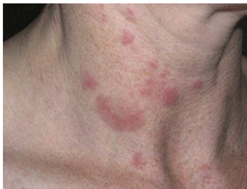
Figura 1 Lesiones características de lupus eritematoso túbido (LET) en el cuello.

Las lesiones del LET consisten en pápulas, placas o lesiones anulares, eritematosas, de aspecto suculento, que aparecen de forma predominante en las zonas fotoexpuestas como el