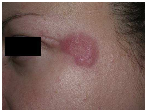
Figura 2 Lesiones características de lupus eritematoso túbido (LET) en la cara.

escote, los hombros, la cara o los brazos. Los rasgos que diferencian las lesiones del LET de las del LED y el LECS son la ausencia de descamación, de tapones foliculares y de atrofia (figs. 1-3); además curan sin dejar cicatriz ni hipopigmentación 9-12,14-16 . Las lesiones tienden a aparecer en forma de brotes, casi siempre en relación con la exposición solar, de forma predominante en la primavera y el verano. Es importante tener en cuenta el curso que siguen las lesiones tras la fotoexposición, pues nos permitirá ayudar a diferenciar al LET de la erupción polimorfa lumínica.