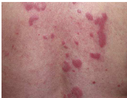
Figura 3 Lesiones características de lupus eritematoso túbido (LET) en la espalda.

escote, los hombros, la cara o los brazos. Los rasgos que diferencian las lesiones del LET de las del LED y el LECS son la ausencia de descamación, de tapones foliculares y de atrofia (figs. 1-3); además curan sin dejar cicatriz ni hipopigmentación 9-12,14-16 . Las lesiones tienden a aparecer en forma de brotes, casi siempre en relación con la exposición solar, de forma predominante en la primavera y el verano. Es importante tener en cuenta el curso que siguen las lesiones tras la fotoexposición, pues nos permitirá ayudar a diferenciar al LET de la erupción polimorfa lumínica.