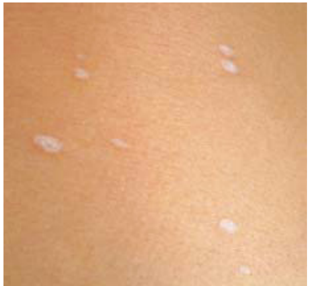
Fig. 8.—Lesiones en tronco.

adoptando un aspecto en vidrio esmerilado. Se aprecia un infiltrado focal perivascular o en banda de células mononucleares y células plasmáticas, que separa la dermis papilar edematosa de la dermis reticular, junto a capilares dilatados. En casos avanzados la piel adquiere el aspecto de un proceso cicatrizal inespecífico. Estas lesiones histológicas del liquen escleroso pueden asociarse a cambios de liquen plano o morfea 34,35 .