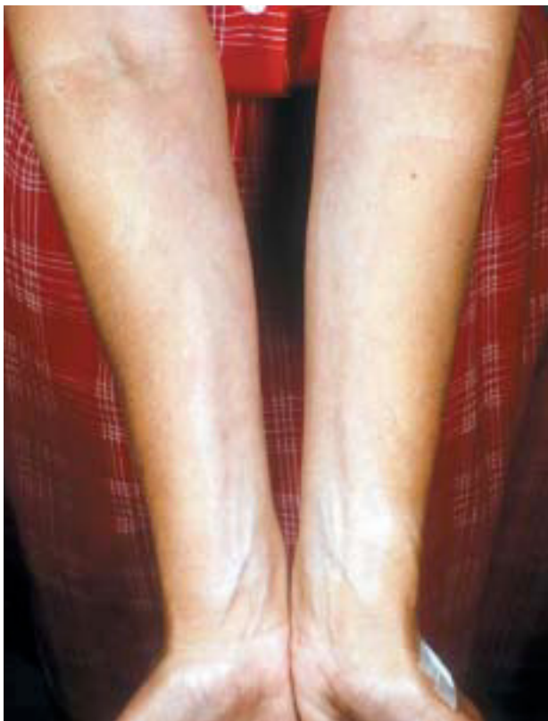
Fig. 9.—Lesiones en cara flexora de muñecas.