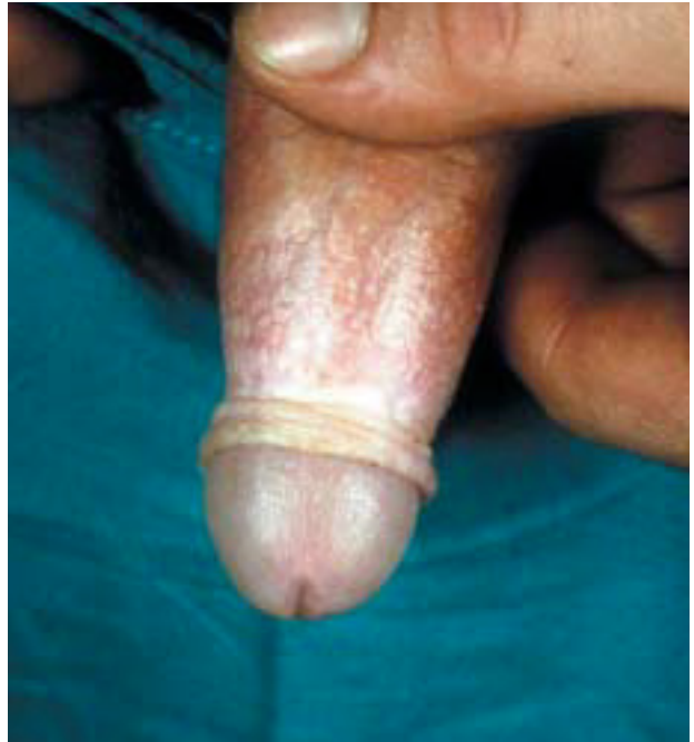
Fig. 6.—Banda esclerosa en prepucio.