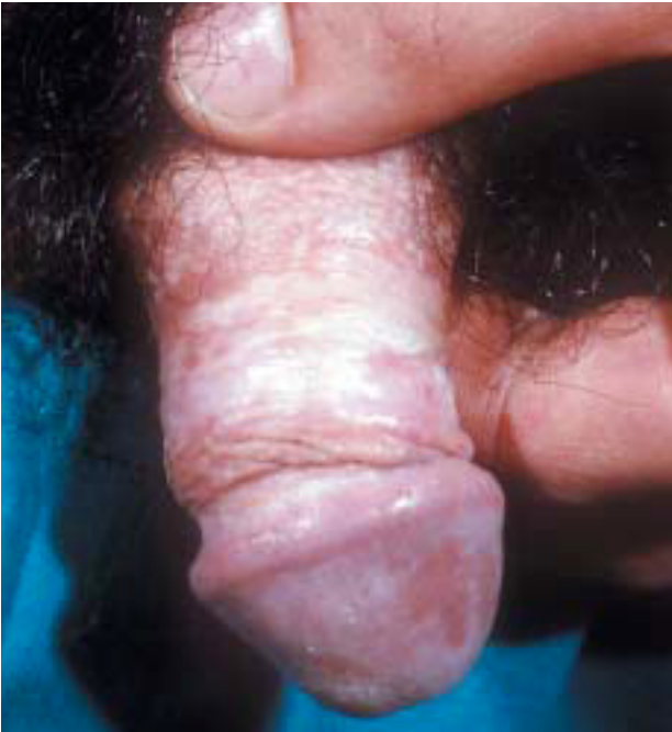
Fig. 5.—Afectación del pene.