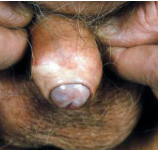
Fig. 7.—Evolución de la afectación del pene hacia la balanitis xerótica obliterante.