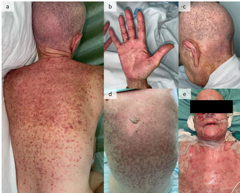
Figura 1 Características clínicas. (a–c) Erupción maculopapular con compromiso de tronco, región palmoplantar, cuero cabelludo, y zona retroauricular. (d) Signo de Nikolsky positivo. (e) Desprendimiento epidérmico.