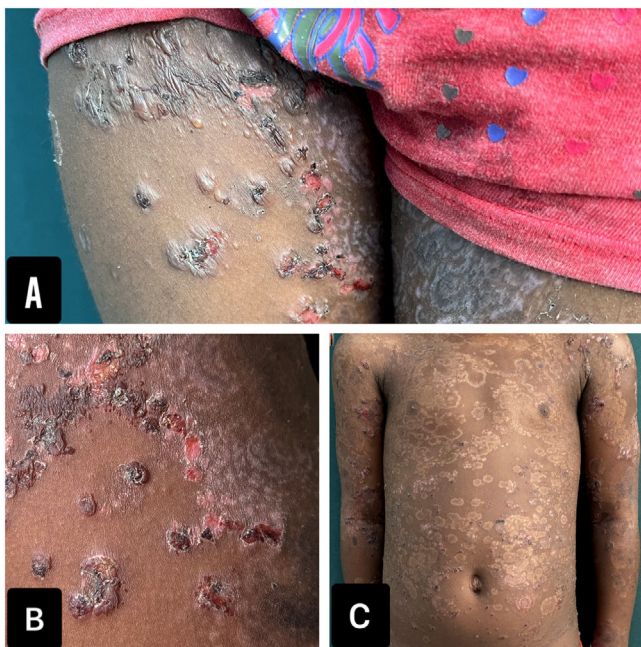
Figura 1 Fotografías clínicas. A y B) Muslos con ampollas tensas y costras hemorrágicas distribuidas en rosetas. C) Máculas hipopigmentadas residuales, con un patrón en rosetas.

importancia tenía un diagnóstico de rasgo de células falciformes, que había sido asintomático hasta el momento. Al examen físico se apreciaba una paciente con un fototipo V, con múltiples ampollas tensas, distribuidas en rosetas, asociadas a costras hemáticas y a máculas hipopigmentadas residuales (fig. 1). En las exploraciones complementarias llamaba la atención una anemia microcítica con anisocitosis. Se realizó una biopsia de piel que mostró la presencia de una ampolla subepidérmica, con un infiltrado inflamatorio rico en neutrófilos y una inmunofluorescencia directa (IFD), que fue negativa para IgG, IgM y C3, pero positiva para IgA con un patrón lineal en la zona de la membrana basal (fig. 2). Por falta de disponibilidad en la institución, no se realizaron inmunofluorescencia indirecta ni otros estudios antigénicos.