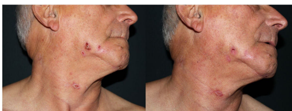
Figura 1 Placas eritemato-costrosas submandibulares, antes y después del tratamiento.

El estudio histológico mostró la existencia de vesiculación subepidérmica acompañada de un infiltrado predominantemente mononuclear y fibrosis (fig. 3A). En el estudio de inmunofluorescencia directa se demostró la presencia de depósitos lineales en la lámina basal de inmunoglobulina G, C3 y fibrinógeno (fig. 3B).