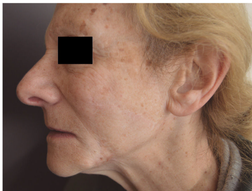
Figura 2 Resultado después de 5 años de la cirugía. Obsérvese el agradable resultado cosmético que se obtuvo.

preauricular y de cuello, su uso como zona dadora de un colgajo fue considerado como la opción más válida. Una alternativa podría haber sido el colgajo de rotación y avance, para el cual se diseñaría el defecto de forma ovoide y el colgajo se formaría trazando una línea desde la parte superior hacia atrás, alrededor de la patilla, hacia abajo en el pliegue preauricular y luego alrededor del lóbulo de la oreja para seguir la línea hasta el cuello, de forma tal que al rotarlo hacia arriba y adelante cubriría la herida 4,5 . Sin embargo, pese a sus ventajas y dado que este tipo de colgajo suele conllevar un gran movimiento de tejido, no se optó por él 2,4 .