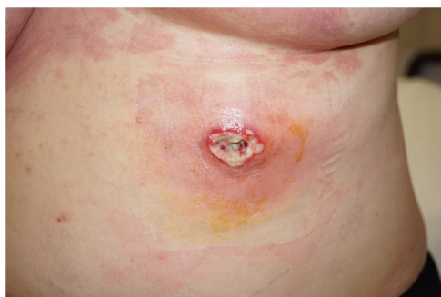
Figura 4 Pioderma gangrenoso en el tronco.

vasculares, microabscesos, vasculitis leucocitoclástica y trombosis de vénulas y arteriolas que pueden estar parcial o totalmente organizados. No se han descrito casos con inflamación granulomatosa 9 .