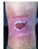
; C6 (Úlcera venosa activa):