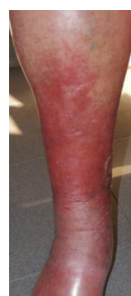
; C4a (Dermatitis de estasis):