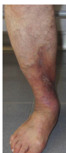
; C4b (Lipodermatosclerosis):