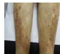
; C4a (Dermatitis ocre):