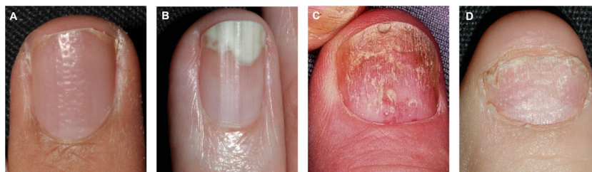
Figura 1 Manifestaciones clínicas por afectación de la matriz ungueal. A) Piqueteado o pitting ungueal. B) Onicólisis con pseudo-leuconiquia. C) Distrofia ungueal o crumbling y manchas rojas en la lúnula. D) Traquioniquia.