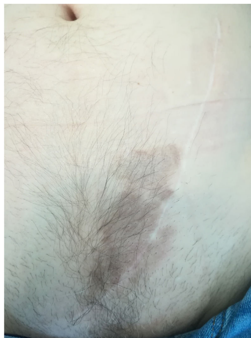
Figura 3 Regresión del sarcoma de Kaposi después del cambio de tacrolimus a everolimus.

La incidencia del SK entre los receptores de trasplantes de órganos sólidos es 500 veces superior al de la población general, lo que indica el papel que juega la inmunosupresión en el desarrollo de la enfermedad 3 . El SK yatrogénico se presenta principalmente con manifestaciones cutáneas 3,4 .