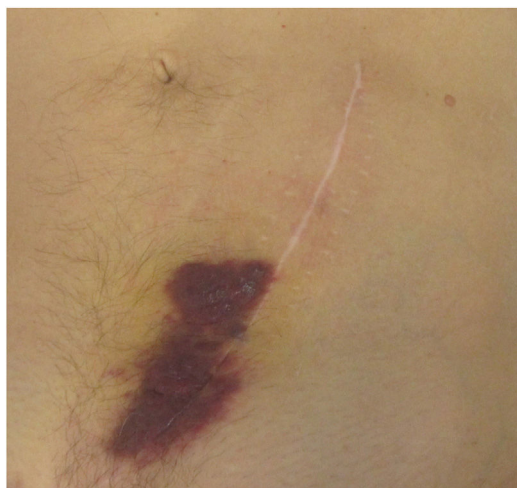
Figura 1 Sarcoma de Kaposi cutáneo en la cicatriz quirúrgica.

El SK yatrogénico, asociado a fármacos inmunosupresores, es frecuente entre receptores de trasplantes renales, representando < 3-4% de todas las neoplasias 2 .