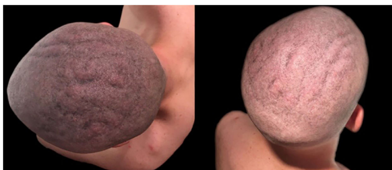
Figura 1 Se observan pliegues que conforman surcos y crestas en dirección antero-posterior en el cuero cabelludo.

El CVG secundario es debido a la alteración causada en la piel del cuero cabelludo por otras enfermedades como acromegalia, mixedema, síndrome de frágil X, síndrome de Klinefelter, esclerosis tuberosa, psoriasis, eczema, enfermedad de Darier, depósito de amiloide, nevus o hamartomas extensos, leucemia, síndrome de Ehlers-Danlos o traumatismos 1-3 .