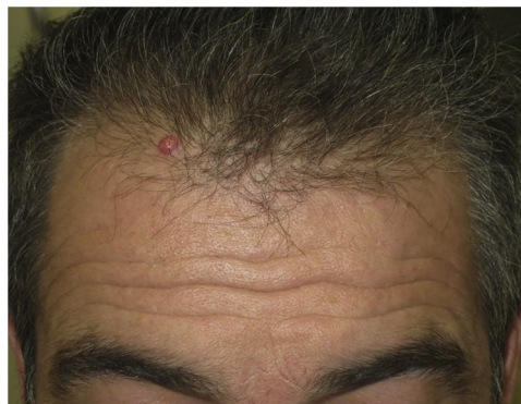
Figura 1 Tumoración de 4 meses de evolución en la línea de implantación capilar de un adulto.

Al tratarse de un tumor benigno, que además aparece de forma frecuente en niños, es interesante poder llegar a su diagnóstico mediante pruebas no invasivas. En los últimos años han sido descritos los hallazgos dermatoscópicos que, aunque no son específicos, sí nos pueden ayudar a realizar un