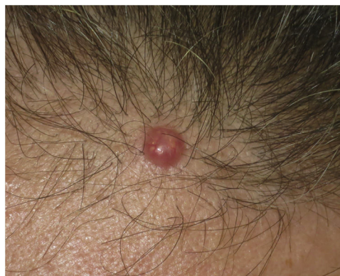
Figura 2 Nódulo firme eritemato-rosado brillante muy bien delimitado de 8mm de diámetro.

diagnóstico de sospecha. Los hallazgos dermatoscópicos más frecuentes son las estructuras vasculares. Es muy frecuente encontrar zonas rojizas homogéneas, vasos lineales irregulares y hairpin vessels , que corresponderían a la importante proliferación vascular dérmica. Sin embargo, los hallazgos más relevantes son, sin duda, las estructuras blanquecinas irregulares (incluyendo proyecciones blancas) que suelen ser llamativas por presentarse de forma bien definida