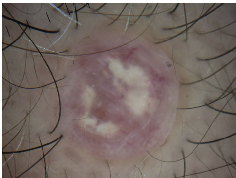
Figura 4 Mediante el estudio dermatoscópico de contacto prácticamente desaparece el componente vascular tan notable y predominan las estructuras blanco-grisáceas sobre un fondo rosado pálido.

y de un color intenso. Estas estructuras corresponden histológicamente a las zonas de calcificaciones, tan típicas de este tumor. Además, también se puede observar ulceración o estructuras gris-azuladas en un porcentaje menor de los casos. En conclusión, la combinación de un patrón vascular prominente con zonas rojizas homogéneas y vasos lineales irregulares con estructuras blanco-grisáceas intensas nos debería hacer plantearnos el diagnóstico de pilomatricoma.