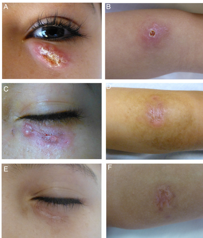
Figura 1 Aspecto clínico de las lesiones producidas por Leishmania major . A-B) Antes de iniciar el tratamiento: placa de tonalidad eritematosa, ovalada, de bordes ligeramente infiltrados con presencia de una costra central localizada en el párpado inferior y en el antebrazo izquierdo. C-D) Respuesta clínica tras 4 sesiones de TFD. E-F) A los 3 meses de haber finalizado el tratamiento.

Tras valorar las opciones disponibles, iniciamos tratamiento con terapia fotodinámica (TFD) utilizando metilaminolevulinato como fotosensibilizante. Antes de cada sesión eliminamos la costra y aplicamos el fotosensibilizante en las lesiones y en 5 mm de piel perilesional, cubriéndolas con apósito oclusivo protector de luz durante 3 h. Para