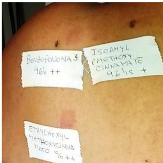
Figura 5 Reacciones en la zona irradiada a oxibenzona y a dos cinamatos confirmando DCFA a filtros solares orgánicos. Se reemplazan por pantallas físicas.

Tinosorb M® incluido en la batería de fotoalérgenos; este no suele comportarse como cromóforo sensibilizador, sino como hapteno de alergia por contacto. No observamos ningún caso de fotoalergia a ketoprofeno ni a octocrileno en nuestro estudio, pero sí 2 a dexketoprofeno sin relevancia conocida.