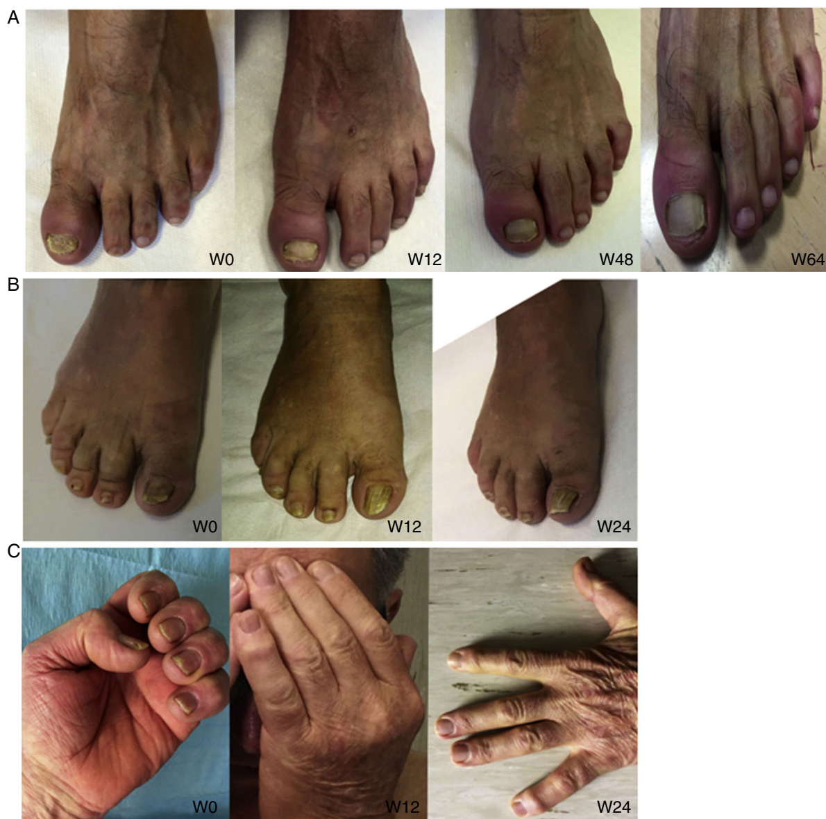
Figura 2 Blanqueamiento de las características comunes de la psoriasis ungueal en 3 pacientes diferentes.

población pequeña, fue evaluar la eficacia y seguridad del CZP en el tratamiento de la psoriasis ungueal. Los criterios de inclusión fueron: edad > 18 años con diagnóstico clínico e instrumental (ultrasonidos y/o resonancia magnética nuclear [RMN]) de psoriasis ungueal y AP de más de 6 meses, que no responden o que bien tienen contraindicados los FAME convencionales, incluidos el metotrexato, azatioprina o leflunomida. También se incluyeron pacientes tratados previamente con otros fármacos biológicos (anti-TNF \alpha y/o anti-IL12/23). La evaluación de los pacientes se realizó usando el índice de gravedad de psoriasis ungueal (Nail Psoriasis Severity Index [NAPSÍ]), spA-HAQ, DLQI y una puntuación de actividad de la enfermedad calculada en 44 articulaciones (DAS-44) correlacionada con la velocidad de sedimentación globular (VSG) durante la primera hora (DAS44-ESR) en las semanas 0, 24 y 52 2 . Además, con el fin de realizar una evaluación objetiva de la enfermedad, las uñas fueron fotografiadas en cada visita. NAPSÍ mejoró de 50,34