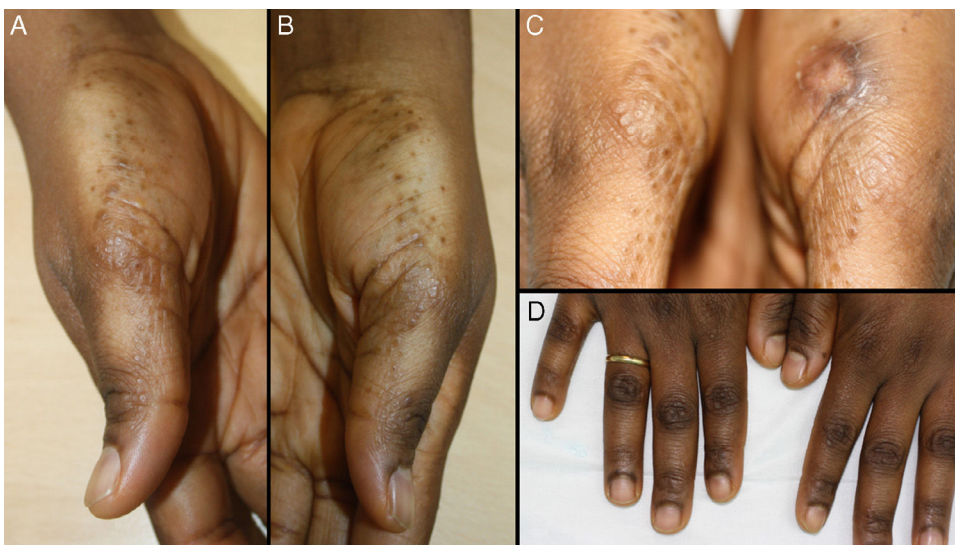
Figura 1 : A-C) Pápulas milimétricas hiperpigmentadas y de color piel normal, de distribución simétrica, superficie brillante de aspecto liquenoide, algunas umbilicadas. D) Hiperpigmentación de articulaciones interfalángicas con algunas lesiones características.