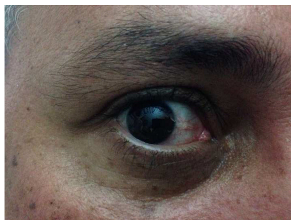
Figura 4 Hiperemia conjuntival.

El impacto de esta enfermedad en nuestro país puede ser considerable debido a: 1) el turismo; 2) al colectivo